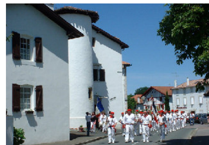
Urt, le centre du village

A moins d'1 km du camping Tous commerces et services médicaux Tennis - Fronton - Fleuve et rivière Itinéraires pédestres et cyclistes